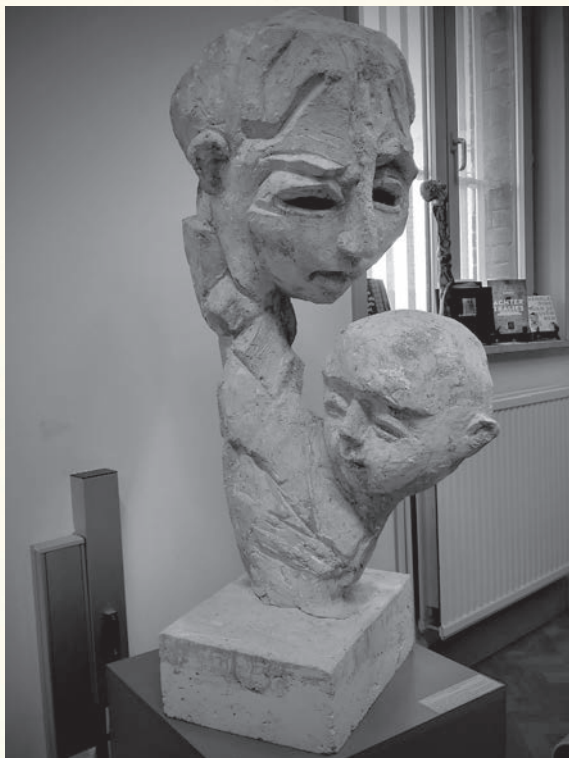
In mijn bureel stond mijn betonnen beeld 'Afstamming'. Elke misdaad is intermenselijk. Ieders eerste relatie is de relatie tot wie hem voortbracht. ©Hans Claus

voor kleinere detentiegebouwen, die hij gewoon 'huizen' noemt, zoals in het laatste gedicht van de bundel. Dan kan 'iets van binnen herbeginnen'. Dan kun je 'het geprevel van een vers horen dat tussen mensen hangt' en 'zonder zorgen ademhalen'.