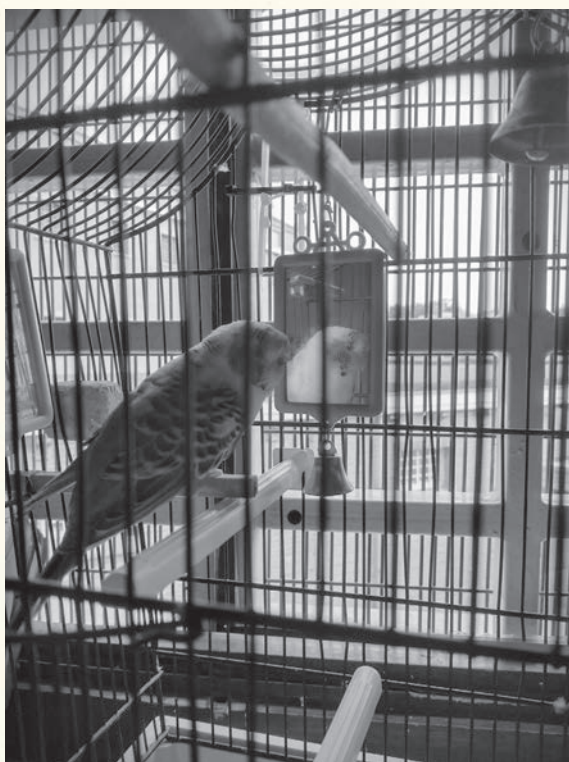
Binnenzicht in de gevangenis van Oudenaarde, vanuit een cel met gekooide parkiet.

Gelieve uw identiteitskaart te tonen, u dient de metaaldetectie bij de ingang te ondergaan. Rolstoelgebruikers wordt gevraagd dit bij inschrijving te melden. Vlotte toegang is voor hen gegarandeerd.